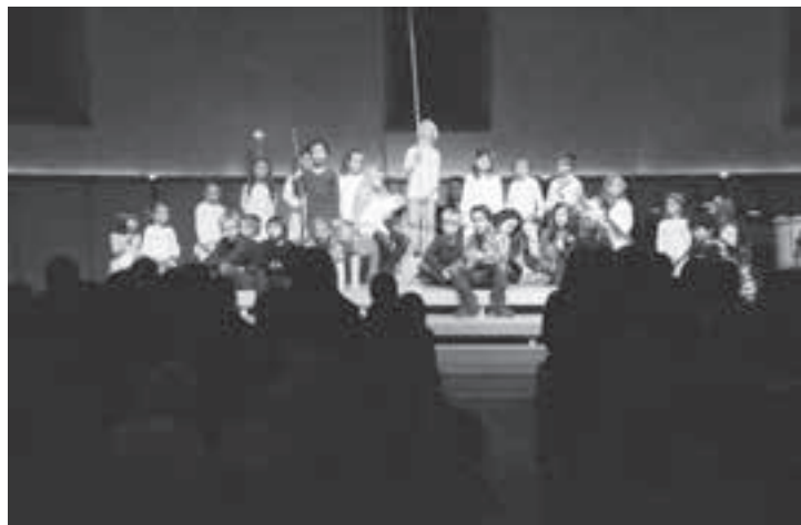
«D'Zäller Wienacht» in Zumikon – ein grosses Ereignis.

Was an den Proben noch teilweise wacklig daher kam, war an der Vorstellung Augenfreude und Ohrenschaus. Und man realisierte, dass das, was Burkhard vor mehr als 50 Jahren für die Kinder in Zelltösstal geschrieben hat, auch heute noch aktuell und lebendig daherkommt. Und so begab es sich, dass sich Josef mit seiner hochschwangeren Maria zur Volkszählung nach Bethlehem begab. Und dort verzweifelt nach einer Unterkunft suchte. Diesem Ansinnen stellten sich