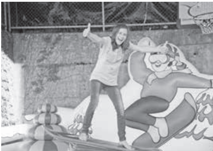
Der Nachwuchs steckt schon in den Startlöchern.