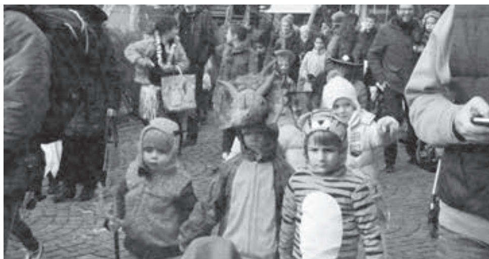
Am Umzug nahm teil, was krecht und fleucht.

Treiben ihrer Lieblinge erfreuten. Da sah man den ganz zoologischen Garten. Und die Hexen- und Zauberwelt, die