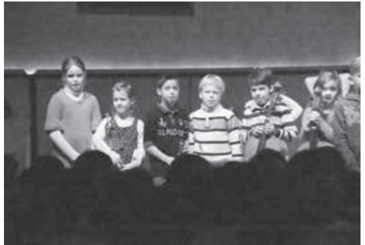
Auch das Kinderorchester hat eine tadellose Leistung gezeigt.

Habgier und Unverständnis in den Weg. Und so mussten sich die herzige Maria und der würdevolle Josef mit einem Stall in Gesellschaft von dessen tierischen Bewohnern begnügen. Und als der Stern von Bethlehem aufging, fanden sich auch die himmlischen (Engel) und irdischen