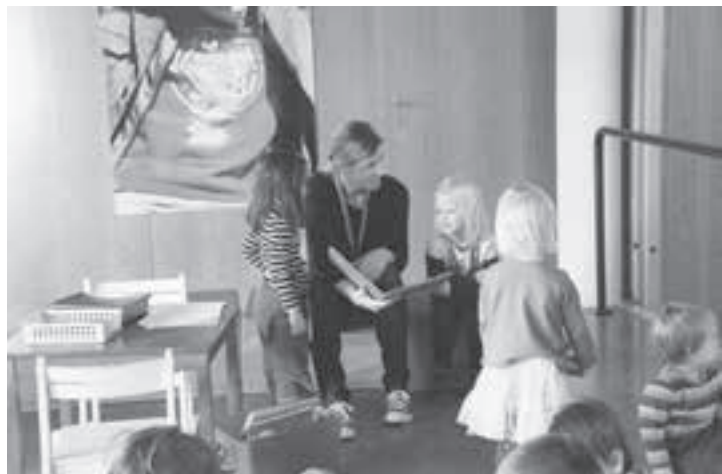
Der Hütendienst ist gut angekommen.