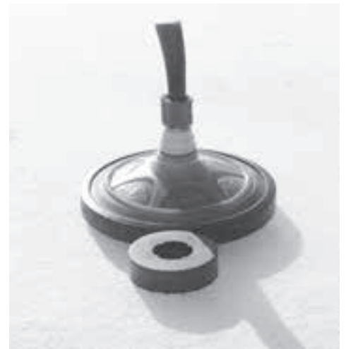
Das Runde muss ans Runde – ein Super-Stock.