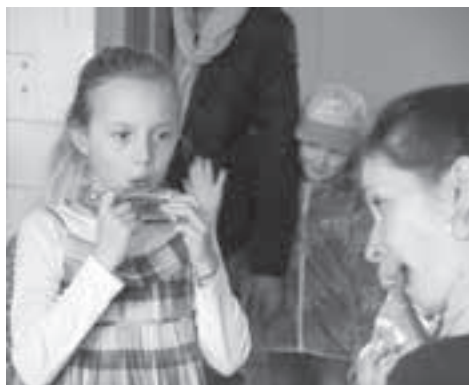
...was höchste Konzentration erfordert...