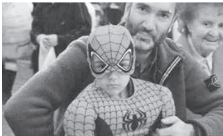
Ein wild entschlossener Spiderman.