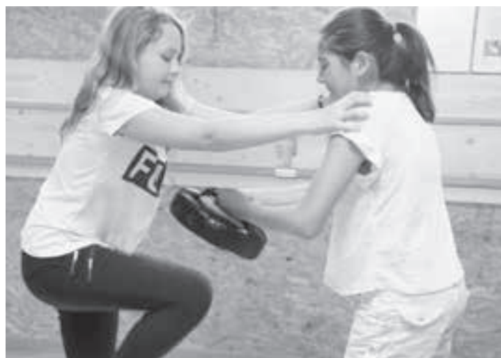
«Autsch» – das würde wehtun.