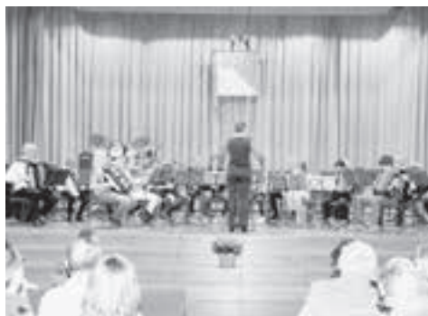
Heuer trugen noch Musikschüler zum konzertanten Erlebnis bei...