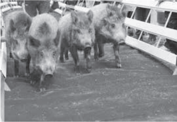
Die Stars auf der Piste beim Säulirennen.