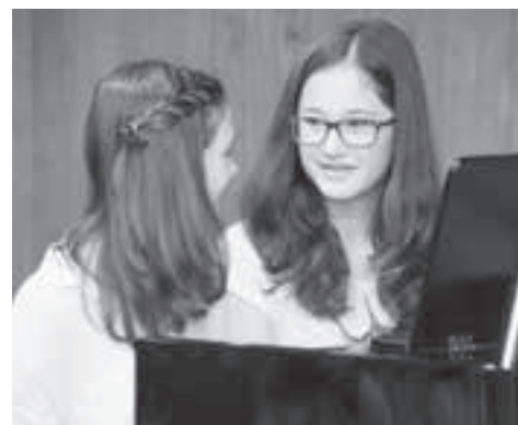
...Hauptsache, man hat auch Spass dabei.