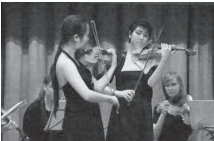
Auch die Solistinnen waren Klasse.