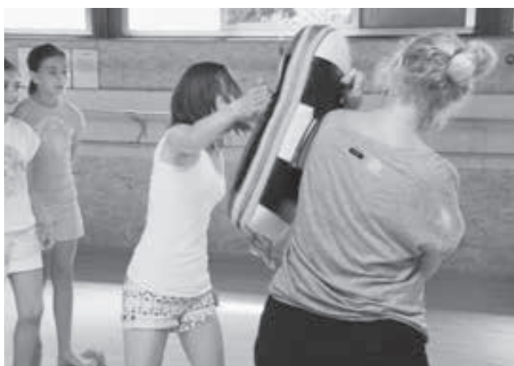
Ganz schön viel Power beim Schlag aufs Kissen.