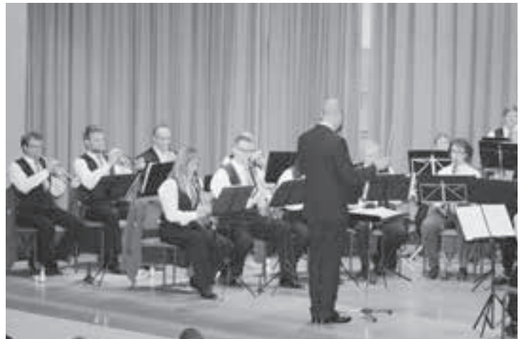
Eine geballte Ladung Musik am Jahreskonzert.