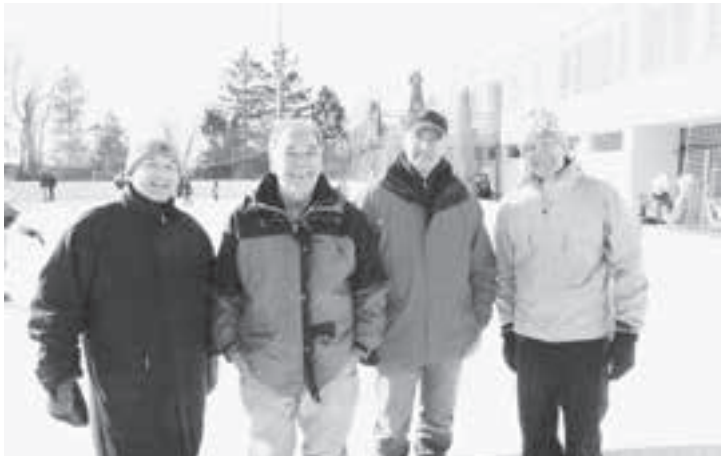
Das Team Gemeinderat platziert sich auf dem guten vierten Rang.