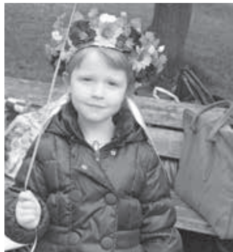
Blumenmädchen bereichern das Bild der Messe.

Das Wetter war zu kühl für die Badi und zu gut, um zu Hause zu sitzen. Es war