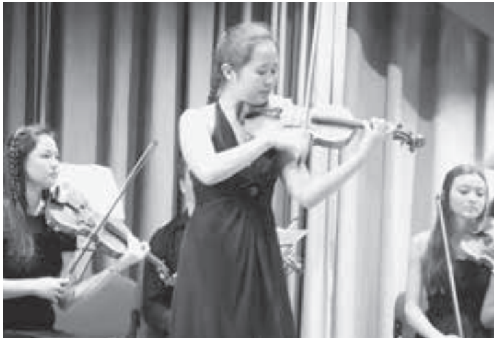
Auffallend viele Streicherinnen haben asiatische Wurzeln.