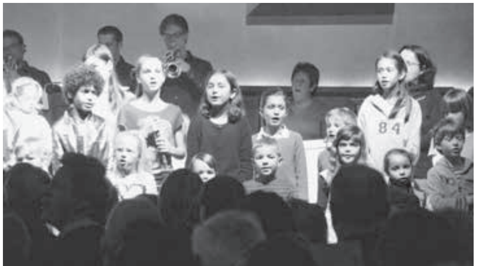
Der Chor singt inbrünstig - und gut.