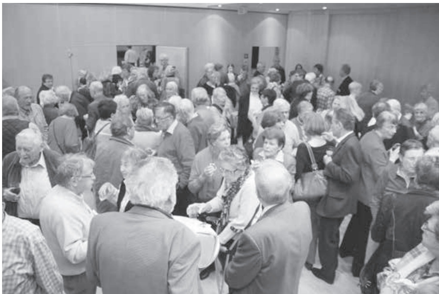
Am Ende der Mitgliederversammlung drängen 260 Seniorinnen und Senioren zum Apéro.

www.seniorenfuersenioren.kusnacht-erlenbach-zumikon.ch