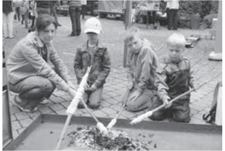
Bei den Cevis gab es «chüschtiges Schlangenbrot».