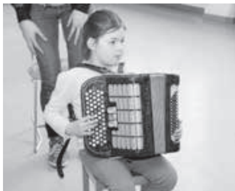
Wo man die verschiedensten Instrumente «erschnuppern» konnte...