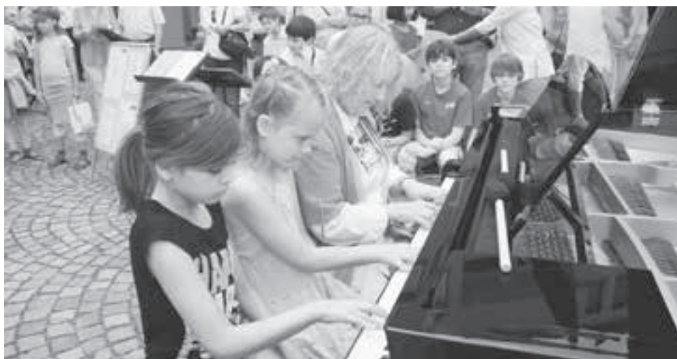
Sechshändig vor dem Dorfbrunnen: die Klavierklasse der Musikschule.

Im Gemeindehaus stellen sich die Schule und die politische Gemeinde vor. Ge-