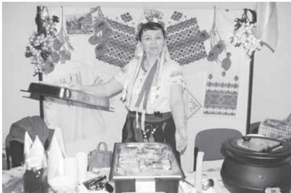
Spezialitäten aus der Ukraine sagen «Grüezi Zumikon».

Spannend, bunt und vor allem international ging es an der «Swiss and International Community-Fair» im Gemeindesaal zu und her.