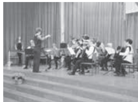
...aber auch ohne viel «auswärtige» Hilfe klang es gut.