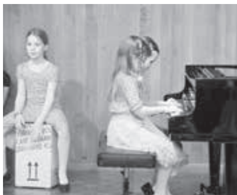
Ob vierhändig mit rhythmischer Begleitung...