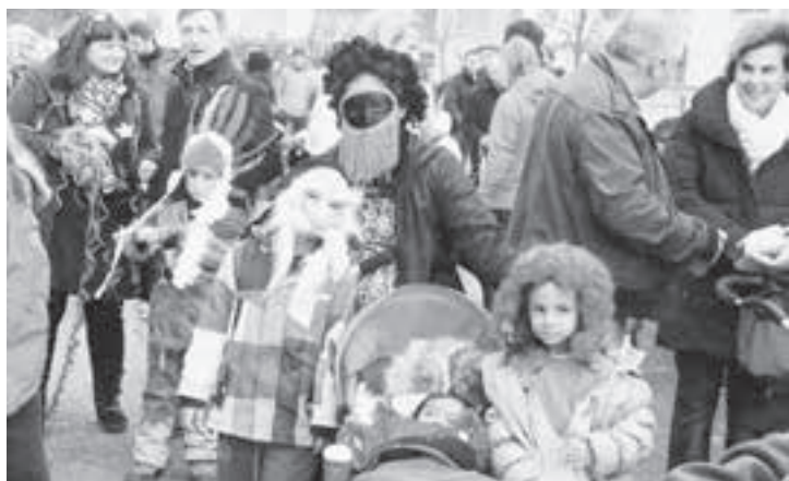
Ein perfektes Grüppchen.