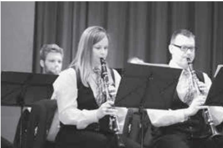
Die Klarinetten jubilieren.