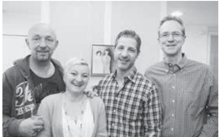
Das Team Gemeindeverein klassiert sich auf dem hervorragenden zweiten Platz.