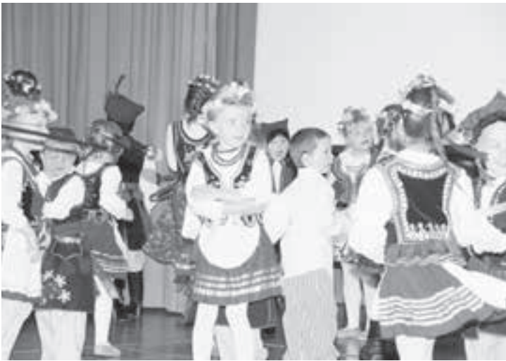
Ukrainische Kinder beim Volkstanz.