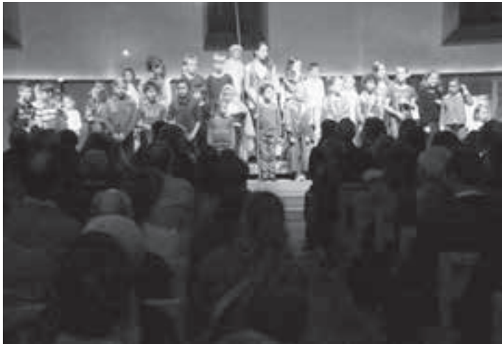
Der Beifall prasselt auf das Ensemble ein