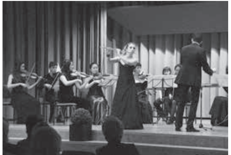
Pimenova begeisterte das Auditorium restlos.