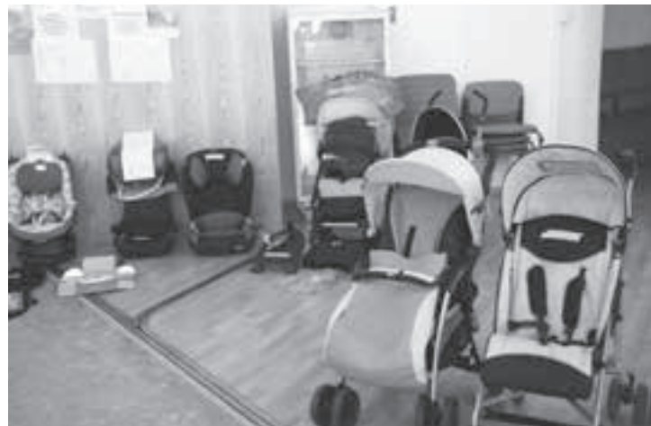
Auch Kinderwagen stehen zum Verkauf.