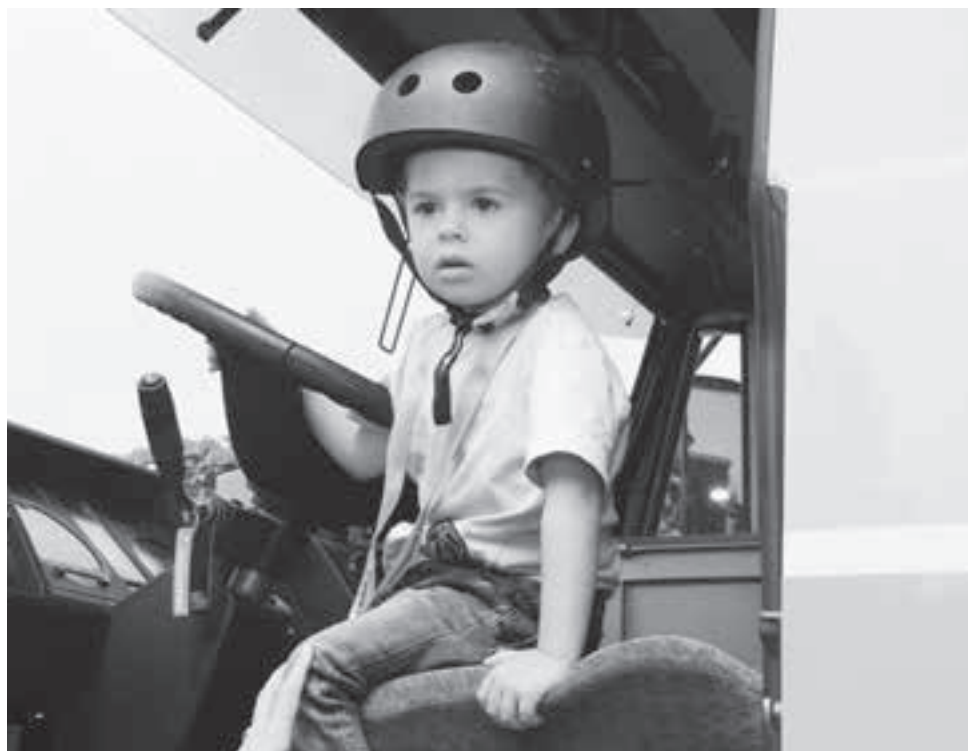
Das Grösste für den Kleinen – am Steuer des grossen Feuerwehrautos zu thronen.

An sieben Treffpunkten erfahren Zumikons Neue Wichtiges über ihre neue Wahlheimat. Allgemein ist man überrascht über das grosse Angebot, das Zumikon seinen Bürgern bietet.