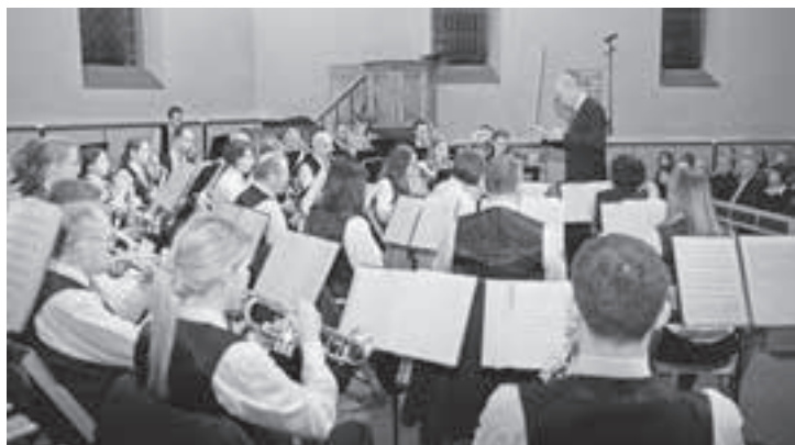
Nabucco mit Pauken und Trompeten von der Harmonie Zumikon.