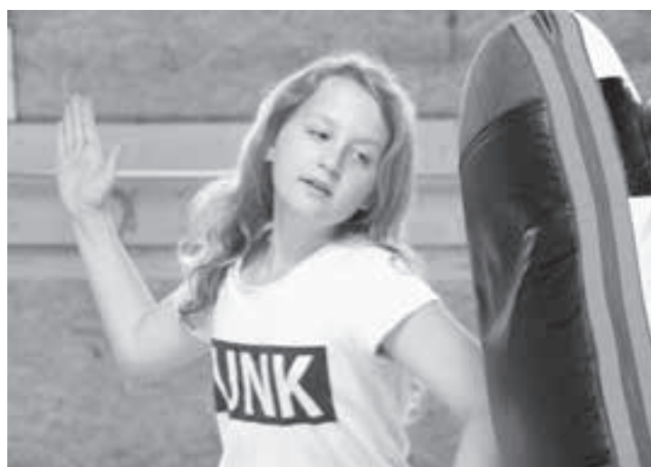
Mit voller Konzentration zuschlagen.