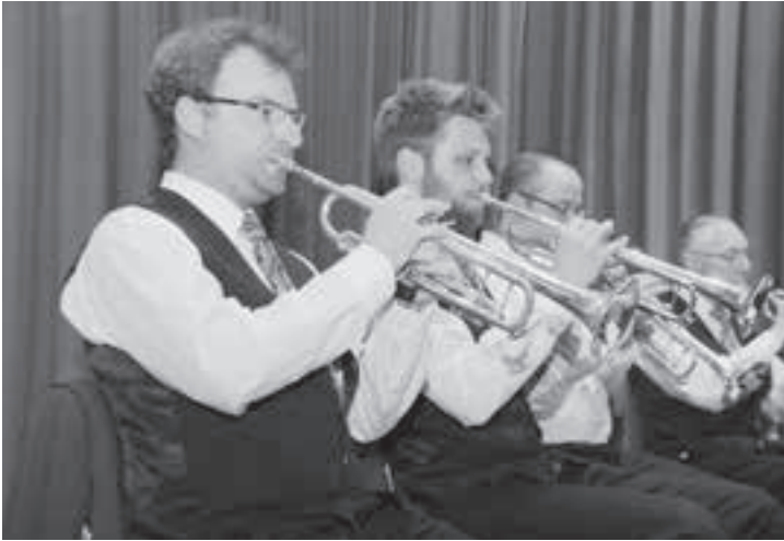
Die Trompeten-Fraktion gibt Gas.