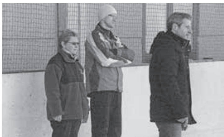
Skeptische Blicke beim Zumiker Gemeindeverein.

Denn das sportliche Niveau ist hoch. Das sieht man, wenn honorable Gemeinderäte und Gemeinderätinnen verzweifelt bemüht sind, auf glattem Eis ihren Stand zu bewahren, während auf dem Eisfeld nebenan kleine Eisprinzessinnen spielerisch ihre Pirouetten drehen und die Leichtigkeit des Seins auf dem Eis de-