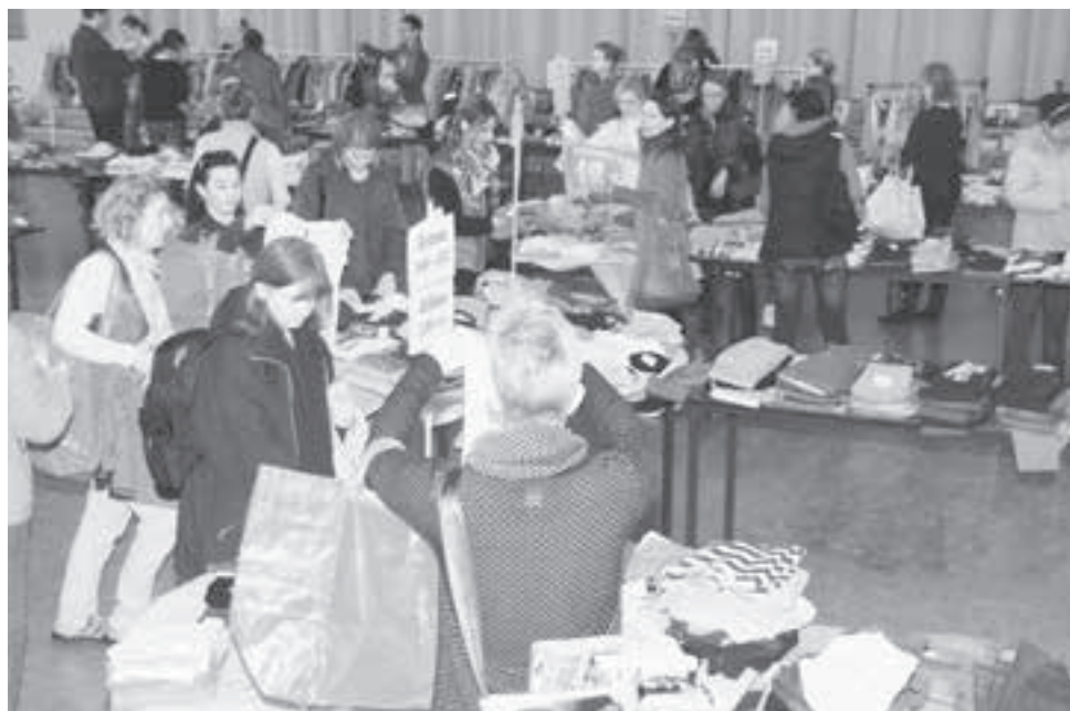
Viel Betrieb im Gemeindesaal bei der Tagesbörse.

Die Zumiker-Tagesbörse bescherte dem Freizeitzentrum einen Reingewinn von 550 Franken. Die Frauen der «mitten-drin»-Gruppe legten sich mächtig ins Zeug.