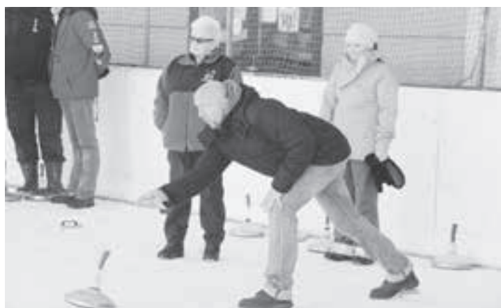
Das Team Gemeindeverein schlägt sich sehr achtbar.