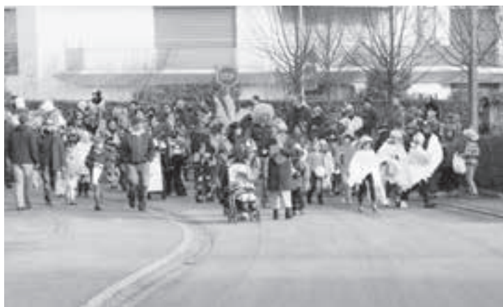
Man nähert sich der Zwischenverpflegung – Punsch und Glühwein warten.

nen ein Kinderfest, das zum allgemeinen Vergnügen zum Schluss mit dem «Beschuss» der gröberen Art mit der Konfetti-Kanone endete. Und den Grossen eine Festwirtschaft, die allen Ansprüchen gerecht wurde. Nicht zu vergessen die Tanz-Show-Einlage der organisierenden Damen, die zweifellos höheren Ansprüchen gerecht wurde. Jetzt können die Fans des bunten Narrentreibens nur noch darauf warten, bis auch 2015 die unübersehbaren Konfetti-Spuren den Weg zum fasnächtlichem Treiben weisen.