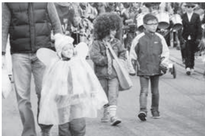
Und immer weiter geht der Umzug.