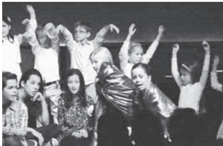
Auch die heiligen 3 Könige huldigen dem neuen König.