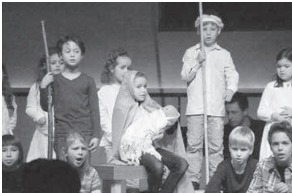
Das Jesuskind ist geboren, alle sind glücklich.