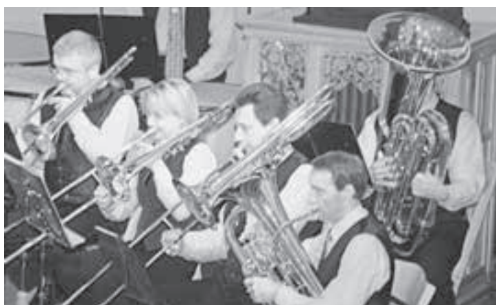
«Ein mächtig Getöse» vom grossen Blech.