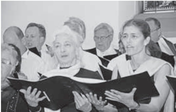
Chorsingen vereint Jung und Alt.