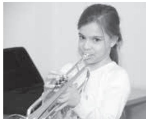
...und zu erstaunlichen Resultaten führt.