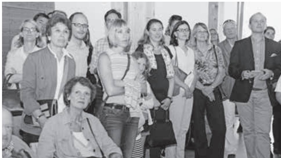
Der gebannte Blick auf die Leinwand – wer schafft es?