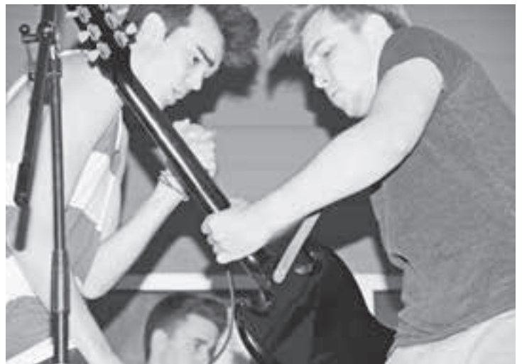
Die Zumiker Band «Bluestuff» rockt die Party gehörig.