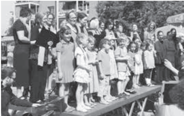
Der Kinderchor der Musikschule begleitet die Grossen.