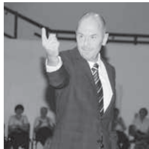
War das ein falscher Ton?

Die Harmonie überzeugte ihre Fans wieder mit ihrem brillanten Können. Jahr für Jahr wird das eingespielte Ensemble, das immer wieder von neuen Gästen aus anderen Harmonien ergänzt wird, immer besser. Kurz, die Harmonie gab alles. Und noch ein wenig mehr. Nämlich tolle Preise, die man an der Tombola gewinnen konnte. Da gabs vom Fruchtkorb bis zum Haushaltgerät alles, was das Herz begehrt.