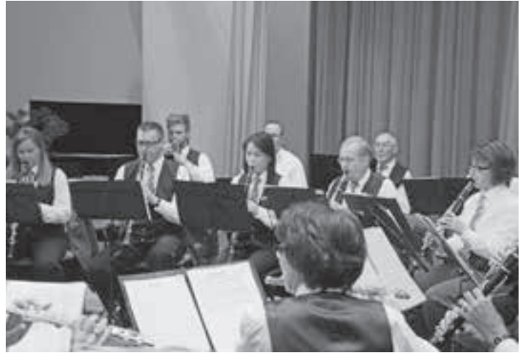
Die Harmonie in Aktion, ein beeindruckendes Bild.