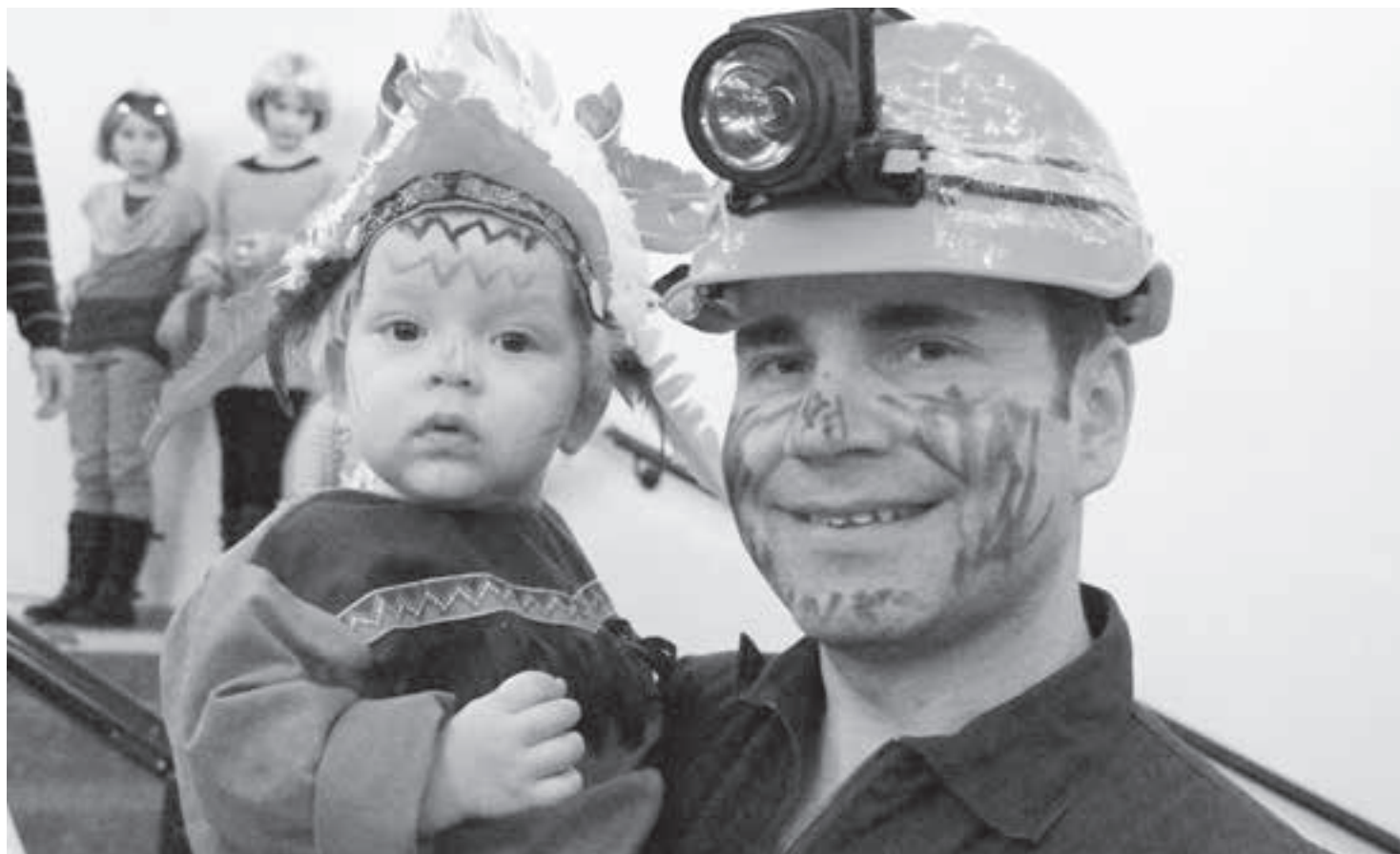
Teil der YMCA: Der Bauarbeiter und der Indianer.

Das närrische Kindertreiben im Februar hinterliess auch heuer wieder seine «Konfetti-Spuren». Ein Blick auf das gelungene Kinderfest.