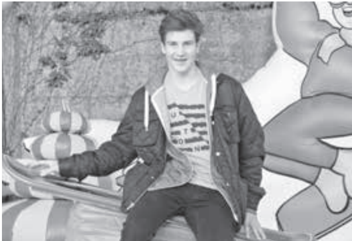
Ein Kreuzbandriss verhindert das Snowboarden momentan.