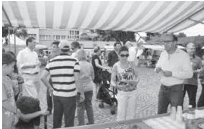
Am Stand der Parteien stellen sich die Ortsparteien vor und suchen das Gespräch mit Interessierten.

«Gschpändli» gefunden haben. «Der Anlass heute ist sehr gut organisiert», lobt sie die Verantwortlichen.