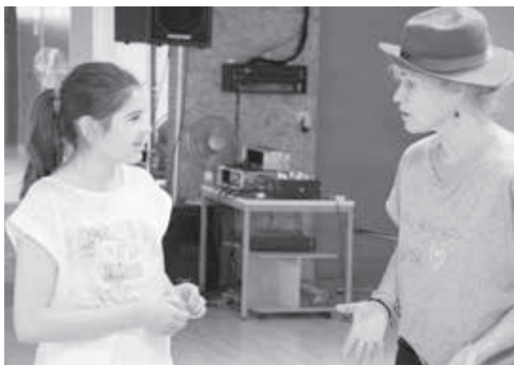
Nicht zurückweichen vor dem «Mann mit Hut».