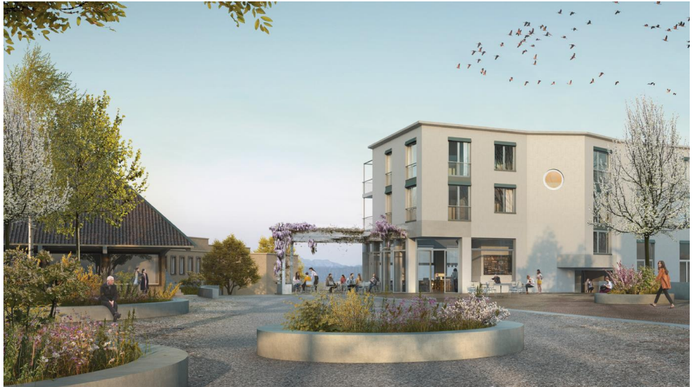
Visualisierung Ersatzneubau mit Gastronomie im Erdgeschoss, Blick ab Dorfplatz in Richtung Südwesten

Die südöstliche Ecke des Neubaus wird von der öffentlichen Nutzung des neuen Dorfrestraurants geprägt. Unter einer Pergola entsteht im Aussenraum ein Gartenrestaurant mit hoher Aufenthaltsqualität und mit freier Sicht Richtung Albiskette.