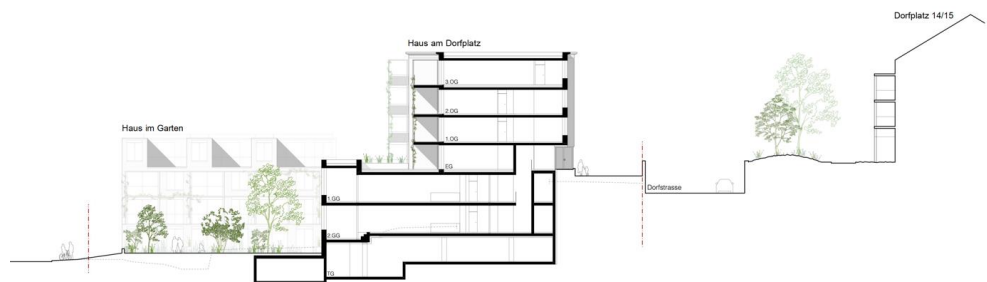
Querschnitt durch den Ersatzneubau mit Höhenbezug zur umliegenden Bebauung

Auch die äussere Erscheinung reagiert auf die zweiseitige Ausrichtung des Gebäudes. Zum Dorfplatz hin gliedern zwei Erker das Gebäude und stellen einen Bezug her zu den prägenden Schrägdächern am Platz. Die regelmässig gesetzten Fenster tragen zum ruhigen Anblick der Fassade bei. Der öffentliche Charakter des Restaurants wird durch seine grossen Fenster unterstrichen. Zum Grünraum hin wird das Volumen kleinteiliger. Eine filigrane Balkonstruktur lässt das Haus zum Garten hin leicht erscheinen. Die Vegetation, die an der Struktur emporwachsen kann, erweitert den Garten in die Vertikale und verknüpft das Gebäude mit der Umgebung.