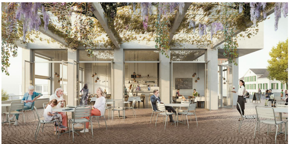
Visualisierung Gastronomie mit Aussenbereich

Beim Restaurant schliesst der neue Platzbelag unmittelbar an die Fassade des Neubaus an und bildet den Abschluss zum bestehenden Dorfplatz. Durch die grossen Fenster verschwimmt die Grenze zwischen Innen und Aussen, das Restaurant verbindet sich so mit dem Dorfplatz.