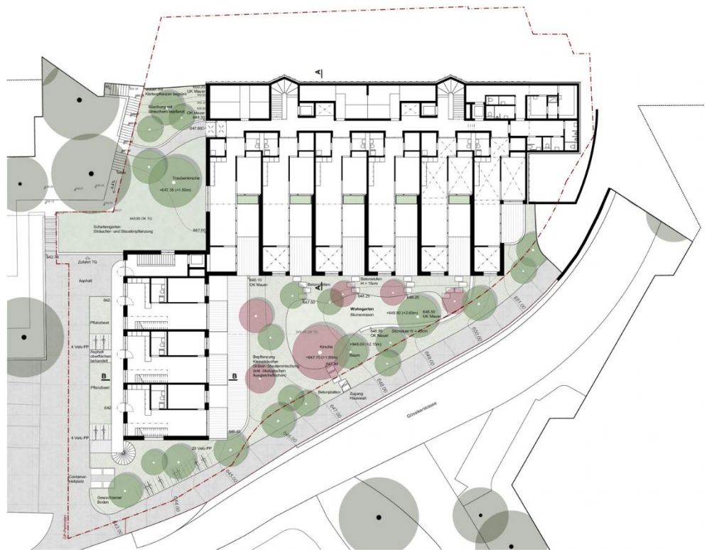
Wohnungsgrundrisse Niveau -1 ab Dorfplatz