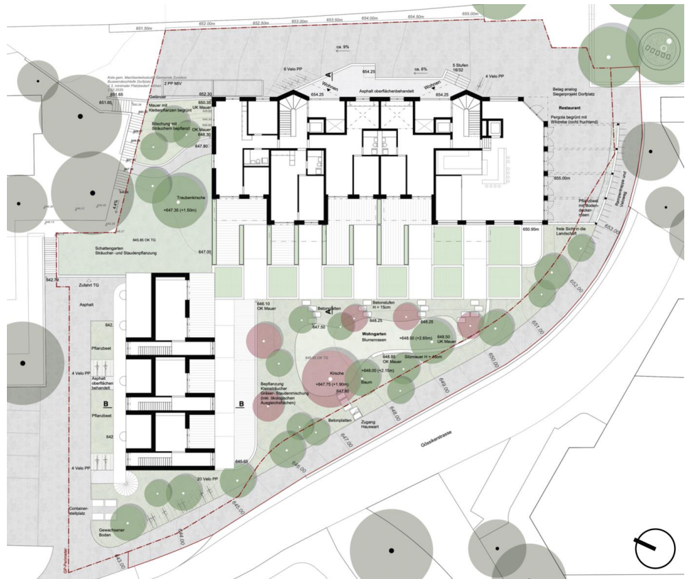
Grundriss Niveau Dorfplatz mit Umgebung

Die Wohnungen verfügen über ein vielfältiges Angebot an Freiräumen im Garten. Ein Pflanzenband mit einheimischen Sträuchern und Stauden rahmt das Gebäude auf der Süd- und Westseite ein. Die naturnahe Bepflanzung, die mit Strukturelementen wie Steinen und Ästen angereichert wird, trägt zur Förderung der Biodiversität im Quartier bei.