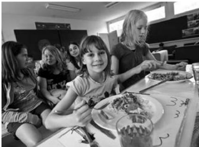
Die schulergänzende Betreuung mit Mittagstisch und Hortbetrieb schafft attraktive Tagesstrukturen.

In der Schule Zumikon werden Kinder vom 1. Kindergarten bis zur 6. Klasse unterrichtet. Danach treten die Schülerinnen und Schüler in die Sekundarschule Zollikon und Zumikon ein oder besuchen ein Langzeitgymnasium. Speziell an der Schule Zumikon ist, dass alle Klassen seit Sommer 2010 altersdurchmischt geführt werden.