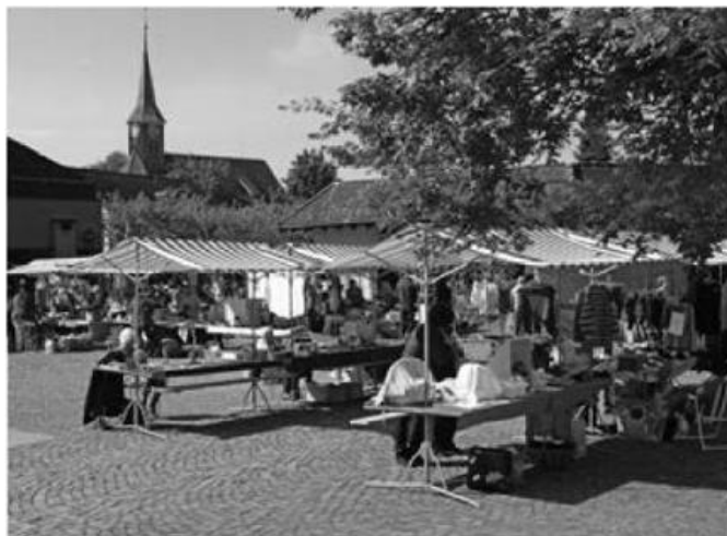
Begegnen – Geniessen – Verweilen – Einkaufen: unser Dorfplatz.

Attraktivität gewinnt Zumikon nicht nur durch das Gewerbe. Einerseits tragen die ländliche Umgebung, die von Grün und Gärten umgebenen Wohnsiedlungen und die nahegelegenen Wälder zu Ruhe und Erholung bei, andererseits erhöht die Nähe zur pulsierenden und multikulturellen Metropole Zürich die Lebensqualität. Zumikon ist eine Vorortgemeinde der Stadt Zürich. Der Dorfplatz ist verkehrsfrei. Die Forchbahn S18 führt Sie in nur 18 Minuten von Zumikon nach Zürich Stadelhofen. Zwei unterirdische Stationen (Maiacher und Zumikon) sowie eine oberirdische Station (Waltikon) sind der Beweis für eine umweltgerechte Verkehrspolitik. Busverbindungen führen nach Küsnacht, Zollikerberg, Zollikon, Bahnhof Tiefenbrunnen und Zürich Bellevue.