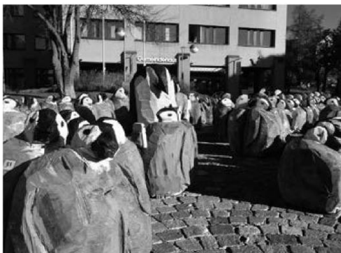
Zumikon bietet ein lebendiges und eigenständiges Kulturangebot (im Bild: «Die Kolonie» von André Becchio).

Zumikon verfügt trotz seiner Nähe zu Zürich über ein lebendiges und eigenständiges Kulturangebot. Viele Kunstschaffende haben sich in Zumikon niedergelassen. Diese namhaften Persönlichkeiten sind in den Bereichen Architektur, Bildhauerei, Grafik, Malerei, Musik, Theater und Töpferei aktiv. Zudem bietet der Zumiker Kulturkreis eine reichhaltige Auswahl an kulturellen Veranstaltungen an. In der Gemeinde- und Schulbibliothek am Dorfplatz haben alle Zugang zu einem gut sortierten Medienangebot, wo sich die Zumiker kulturelles Wissen abholen können.