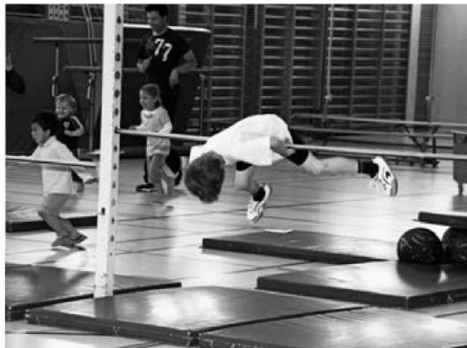
Viel Spass im Eltern-Kind-Turnen in der Sporthalle Farlifang.

Ausserdem gibt es diverse Sportvereine sowie geführte Lektionen von privaten Personen oder vom Freizeitverein. Bereits die Kleinsten erfahren im Muki-Turnen Spass an Bewegung.