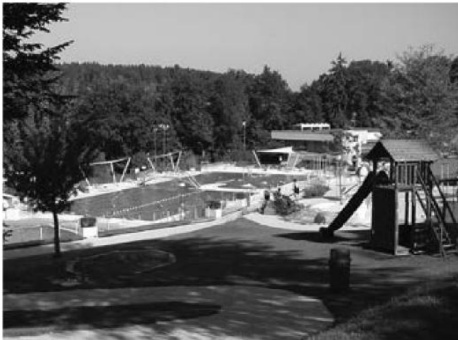
12 Monate im Jahr Badeplausch für alle – die Badi Juch mit Frei- und Hallenbad erfreut sich grosser Beliebtheit.