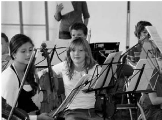
Die Musikschule unterrichtet kleine und grosse Künstler und organisiert regelmässig Konzerte.

Das Angebot wird aufgrund der immer grösseren Nachfrage stetig ausgebaut. Die kulturelle Vernetzung wird gelebt durch das Musikschulangebot, welches durch die enge Zusammenarbeit mit Zollikon und durch den Austausch von Lehrpersonen vielseitiger und breiter wird. Die musikalische Grundausbildung ist in die 1. und 2. Primarklasse integriert und der Instrumentalunterricht wird in der unterrichtsfreien Zeit angeboten. Besonders wichtig ist die vereinte Gemeinde- und Schulbibliothek.