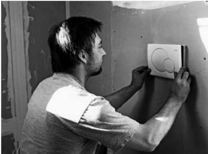
Exakte Arbeit ist die Grundlage jedes Handwerkers – selbstverständlich auch in Zumikon.

Die zahlreichen Zumiker Detaillisten, von A wie Apotheke bis Z wie Zoofachgeschäft, erfüllen praktisch jeden Wunsch für den täglichen Bedarf. Die Restaurants Italia 2000, Rössli und Frohe Aussicht sind in Zumikon beliebt und bieten allerlei kulinarische Köstlichkeiten an.