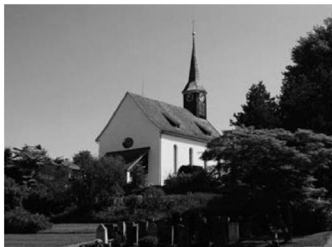
Die reformierte Kirche im Dorfzentrum

Quelle: Statistisches Amt Kanton Zürich, 31.12.2023