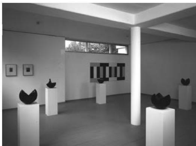
Einer der berühmtesten gestaltenden Künstler der Schweiz war Max Bill. Im ehemaligen Wohnhaus Max Bills finden heute noch ab und zu Veranstaltungen statt (siehe auch www.hausbill.ch ).