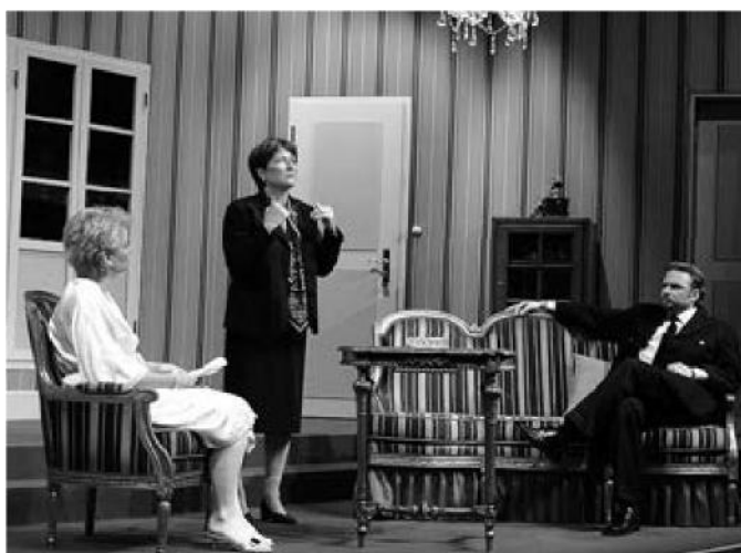
Wer selbst Kultur mitgestalten möchte, sucht in einer Produktion des Dorftheaters seine Rolle des Lebens oder singt oder musiziert in einem der vielen Dorfvereine.