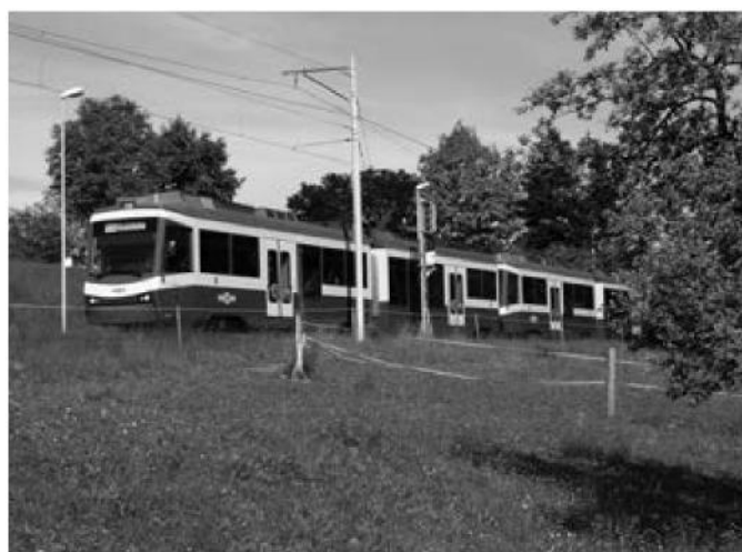
Zuverlässig und schnell: Die Forchbahn bringt Sie in nur 18 Minuten nach Zürich.

Auch im Bereich des Privatverkehrs ist Zumikon hervorragend erschlossen: Hier beginnt die Forch-Autoschnellstrasse. Von Ihrer Haustüre gelangen Sie ohne ein einziges Lichtsignal beispielsweise bis ins Bündnerland oder ins Tessin.