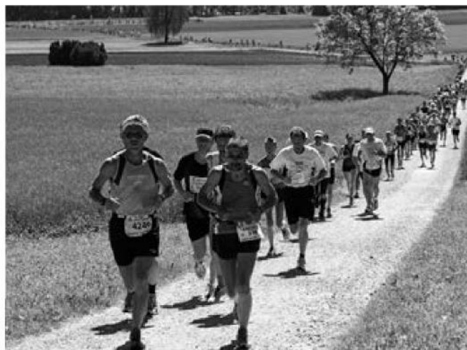
Der Turn- und Sportverein organisiert den Zumiker Lauf, der Jahr für Jahr weit über 1000 Läuferinnen und Läufer anlockt.

Nicht zu vergessen sind die zahlreichen Vereine, die die Grundlage des kulturellen und aktiven Wirkens in der Gemeinde bilden und die Gemeinschaft und das Dorfleben bereichern. Auch das Freizeitzentrum Zumikon setzt sich seit über 30 Jahren für eine attraktive Freizeitgestaltung für Jung und Alt im eigenen Dorf ein.