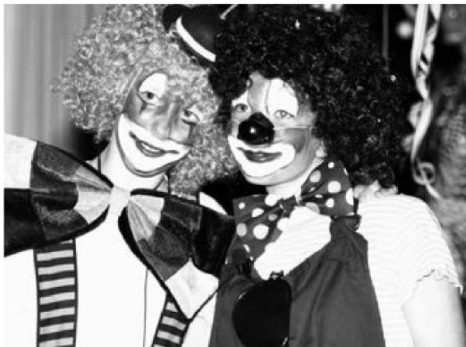
Der Verein Kinder-Fasnacht organisiert jedes Jahr den bei unseren Jüngsten äusserst beliebten Umzug für Clowns, Feen und ähnlichen Figuren.

Zumikon ist keine Schlafgemeinde. Das liegt an den Bewohnerinnen und Bewohnern, die aktiv am vielfältigen und abwechslungsreichen Angebot an Aktivitäten teilnehmen. Behörden und Vereine bieten viele verschiedene Anlässe für Jung und Alt. Hier sind nur einige erwähnt: Neujahrs-Apéro, Zumiker Lauf, Veloplausch, Kinder-Fasnacht, Jungbürgerfeier, Dorfmarkt, Neuzuzüger-Apéro, 1.-August-Feier und vieles mehr.