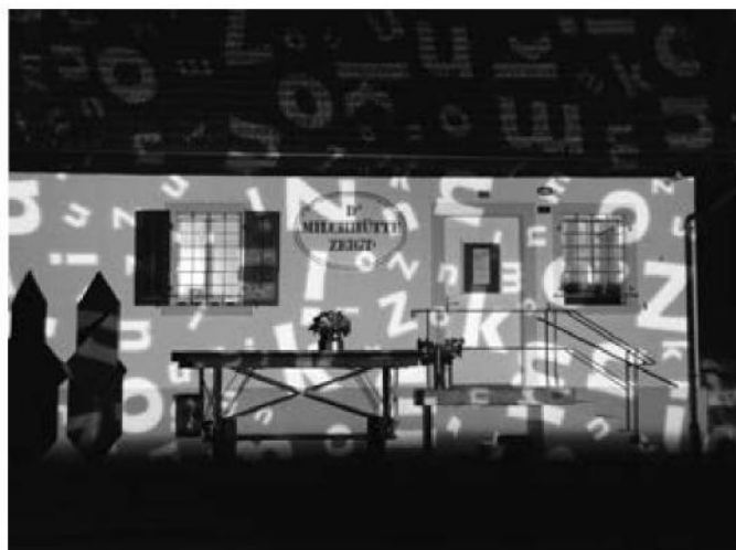
Die Galerie Milchhütte zeigt Arbeiten einheimischer wie auswärtiger Künstlerinnen und Künstler.