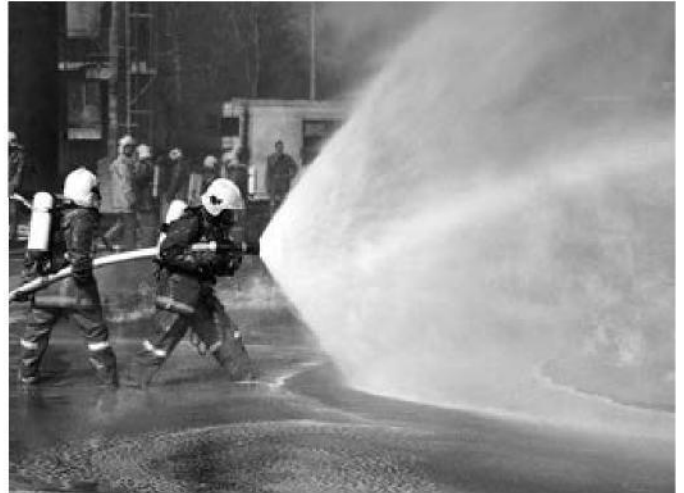
Eine hoch motivierte Zumiker Feuerwehr steht jederzeit zum Einsatz bereit.

Schwimmbadanlage und die Gemeindepolizei. Der Gemeinderat Zumikon als strategische Führung der Einheitsgemeinde besteht aus sieben nebenamtlichen Mitgliedern. Jedes Gemeinderatsmitglied betreut ein ihm zugeteiltes Ressort und vertritt im Gesamt-Gemeinderat die entsprechenden Sachgeschäfte. Entscheide werden als Kollegialbehörde gefällt und vertreten. Weiter bereitet der Gemeinderat auch die Geschäfte für Gemeindeversammlungen oder Urnenabstimmungen vor.