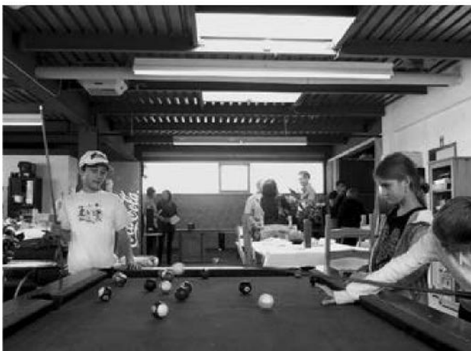
Schülerinnen und Schüler ab der 5. Primarstufe finden im Zumikon verfügt bereits seit Jahren über eine zeitgemässe Alterspolitik Jugendtreff neue Kolleginnen und Kollegen, mit einem vielseitigen und attraktiven Angebot.

Eine offene Heimat. Dank einem starken sozialen Netzwerk, hervorragender Infrastruktur und vielfältigem Kulturangebot.