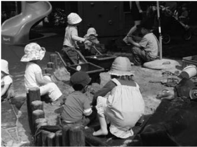
Auf den diversen Spielplätzen können sich die Kinder austoben und vergnügen.

Eine offene Heimat. Dank einem starken sozialen Netzwerk, hervorragender Infrastruktur und vielfältigem Kulturangebot.