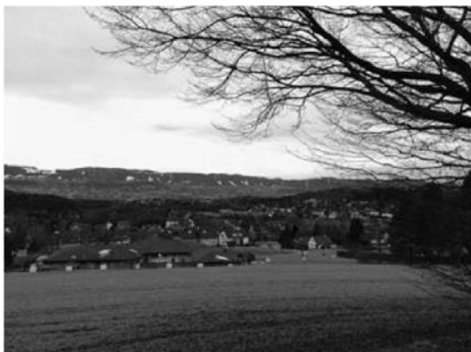
Auf dem Land und doch nur 7 Kilometer vom Zürcher Bellevue entfernt.

Auch im Bereich des Privatverkehrs ist Zumikon hervorragend erschlossen: Hier beginnt die Forch-Autoschnellstrasse. Von Ihrer Haustüre gelangen Sie ohne ein einziges Lichtsignal beispielsweise bis ins Bündnerland oder ins Tessin.