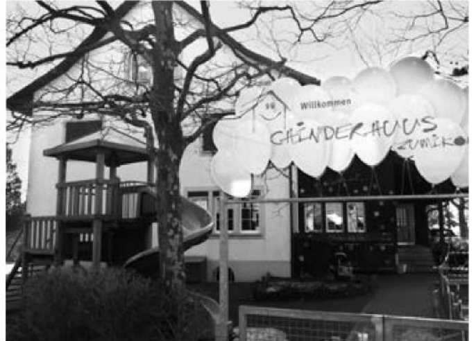
Das Chinderhuus betreut rund 90 Kinder im Vorschulalter und unterstützt damit junge Familien.

Im sozialen Bereich decken verschiedene Institutionen unterschiedliche Bedürfnisse ab. Betagte Menschen, Säuglinge, Kinder und Jugendliche werden betreut, Kranke und Pflege-bedürftige professionell umsorgt. Die Spitex Zumikon-Maur leistet im Auftrag der Politischen Gemeinden umfassende Hilfe in der Krankenpflege und bietet hauswirtschaftliche Dienste, einen Mahlzeiten- und Fahrdienst an. Ist ein Verbleiben in der eigenen Wohnung nicht mehr möglich, steht der Bevölkerung das Zollingerheim (Alters- und Pflegeheim der Gemeinden Maur und Zumikon) in der Forch offen. Die Zumiker Alterswohnungen befinden sich im Thesenacher.