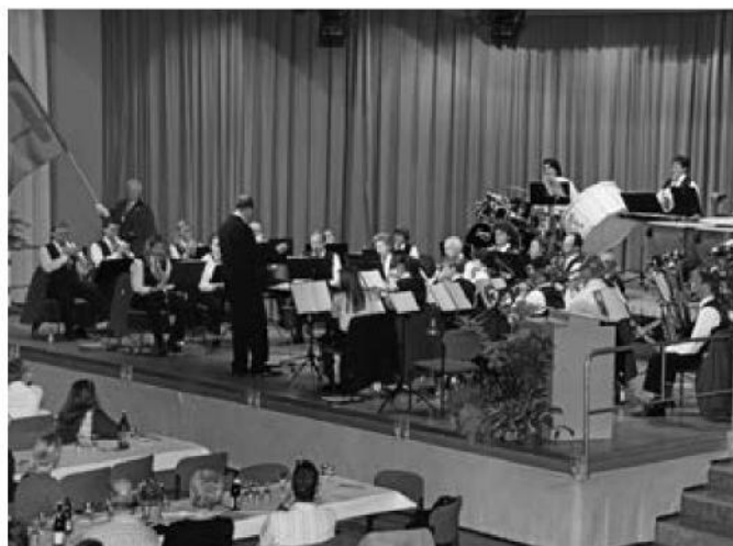
Unsere Harmonie vermag mit ihrem grossen Repertoire nicht nur Musikfreunde zu begeistern.