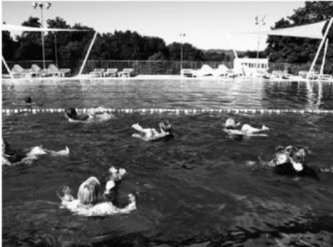
Ob Aquafit, Schwimmkurse oder einfach nur Planschen: die Badi Juch hat für alle Wasserratten etwas zu bieten.

Es stehen verschiedene Sportanlagen zur Verfügung, beispielsweise das Frei- und Hallenbad Juch, die Sportanlage Farlifang, die Finnenbahn in der Isleren oder das Schützenhaus in der Breitwies. Die umliegenden Wälder und Wiesen bieten viel Spielraum für diverse sportliche Betätigungen wie Joggen, Nordic Walking und vieles mehr.