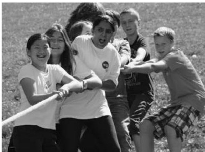
An der privaten, englischsprachigen Inter-Community School (ICS) werden 850 Kinder und Jugendliche aus 55 Nationen ab 3 Jahren bis zur Maturaklasse unterrichtet.

Die Kinder sollen mit gestärktem Rücken, Neugier auf Neues und mit einem gesunden Selbstbewusstsein aus der Primarschule Zumikon in den nächsten Lebensabschnitt wechseln. Die Schule Zumikon ist eine integrative Schule und jede Klasse wird von einer Heilpädagogin unterstützt. Auch Seniorinnen und